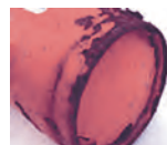
溶接部およびその周辺のさび