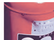
使用に耐えないキズ・変形