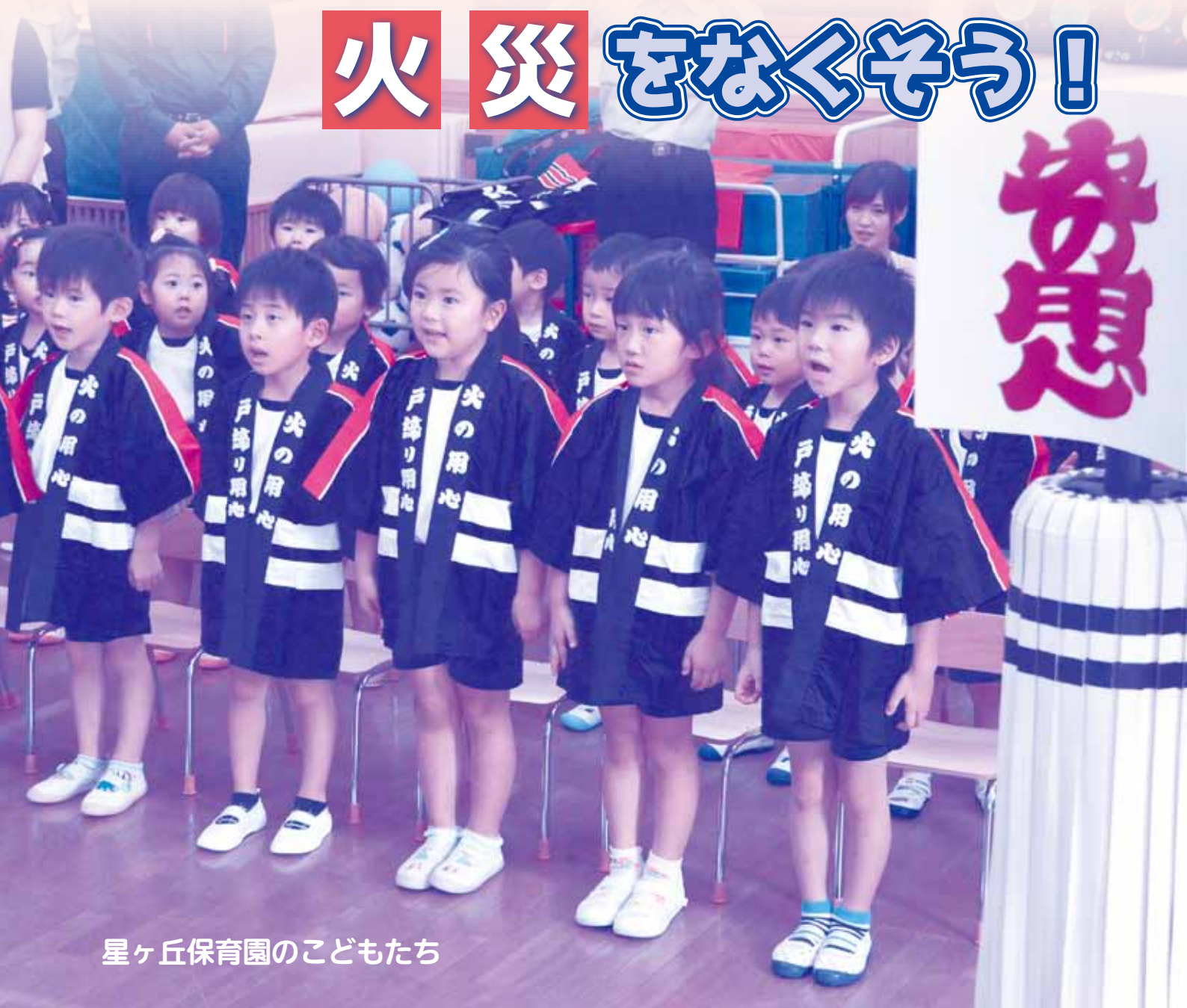
星ヶ丘保育園のこどもたち