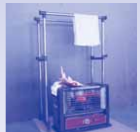
ストーブの上方に干していたタオルが落下し燃える様子を再現しました。