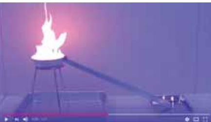
ガソリンによる燃焼実験動画

郡山消防 YouTube チャンネルでは、各種イベントや訓練の様様、火災予防啓発のための燃焼実験動画などを公開しています。