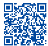
燃焼実験動画は こちらから (郡山消防YouTubeチャンネル)